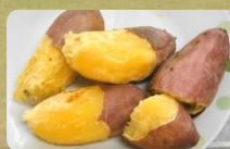
芋ほり&焼き芋体験