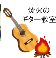
焚火の ギター教室